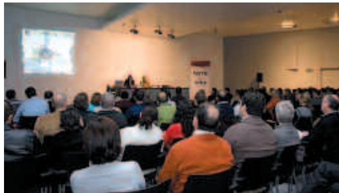
El encuentro reunió a especialistas del mundo del vino: periodistas, directores comerciales, enólogos, expertos en marketing y consultoría de empresas, distribuidores y restauradores de las islas.